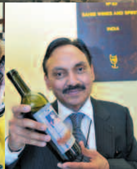
Arriba a la izda., dos cocineros chinos, preparando una de las "armonías sublimes", ésta con Sauternes y Tokay. A su derecha, cata vertical de Aleatico d'Elba, en la Torre del Homenaje. A la izquierda, uno de los stands de Grecia, país invitado este año. A su derecha, representante de la India, país que participaba por primera vez.