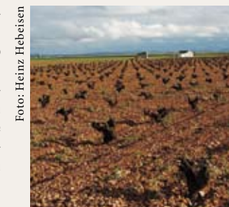
Viñas viejas cultivadas mediante poda en vaso.

tivo en vaso suele ser manual y el empleo de maquinaria está muy limitado. Por eso, el sistema Gobelet es sinónimo de viticultura extensiva y muy laboriosa. Mientras que con el cultivo en espaldera los racimos cuelgan a cierta distancia del suelo y en la zona de los racimos se pueden podar las hojas antes de la vendimia, con la poda en vaso, que asemeja la cepa a un arbusto, los racimos crecen en el interior del follaje y más cerca del suelo, debido a lo cual las uvas tardan más en secarse en caso de lluvia.