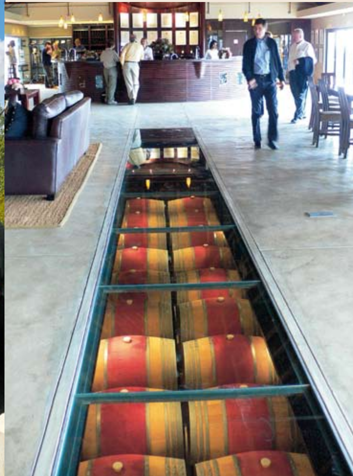
Sudáfrica: nueva generación de viticultores. Pág.44