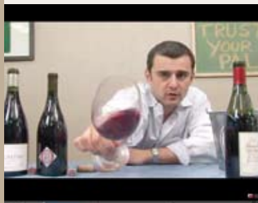
Catas originales y divertidas para cambiar el mundo del vino.