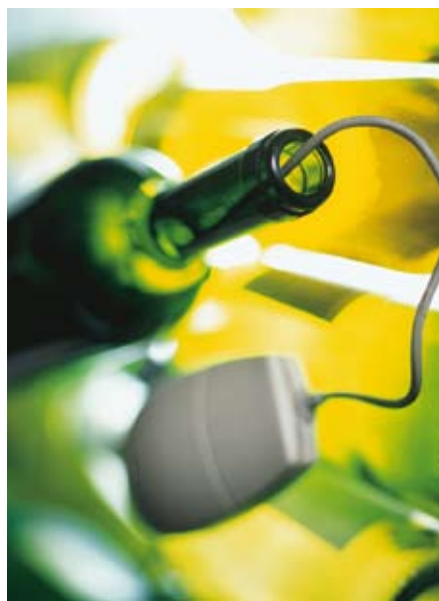
La compra de vino por Internet se ha convertido en una canal de comercialización con futuro.

Desde hace tiempo, Internet es un medio muy interesante para el aficionado al vino. En la Red se pueden comprar prácticamente todos los vinos del mundo. Lo que considero más arriesgado es la compra en sí, la seguridad a la hora de seleccionar unos vinos sin saber en qué condiciones de conservación están, las garantías de privacidad en el pago, los plazos de entrega... Porque existen infinidad de tiendas en la Red y es difícil saber elegir ¿Qué normas básicas debería seguir para que mi compra no sea un fracaso?