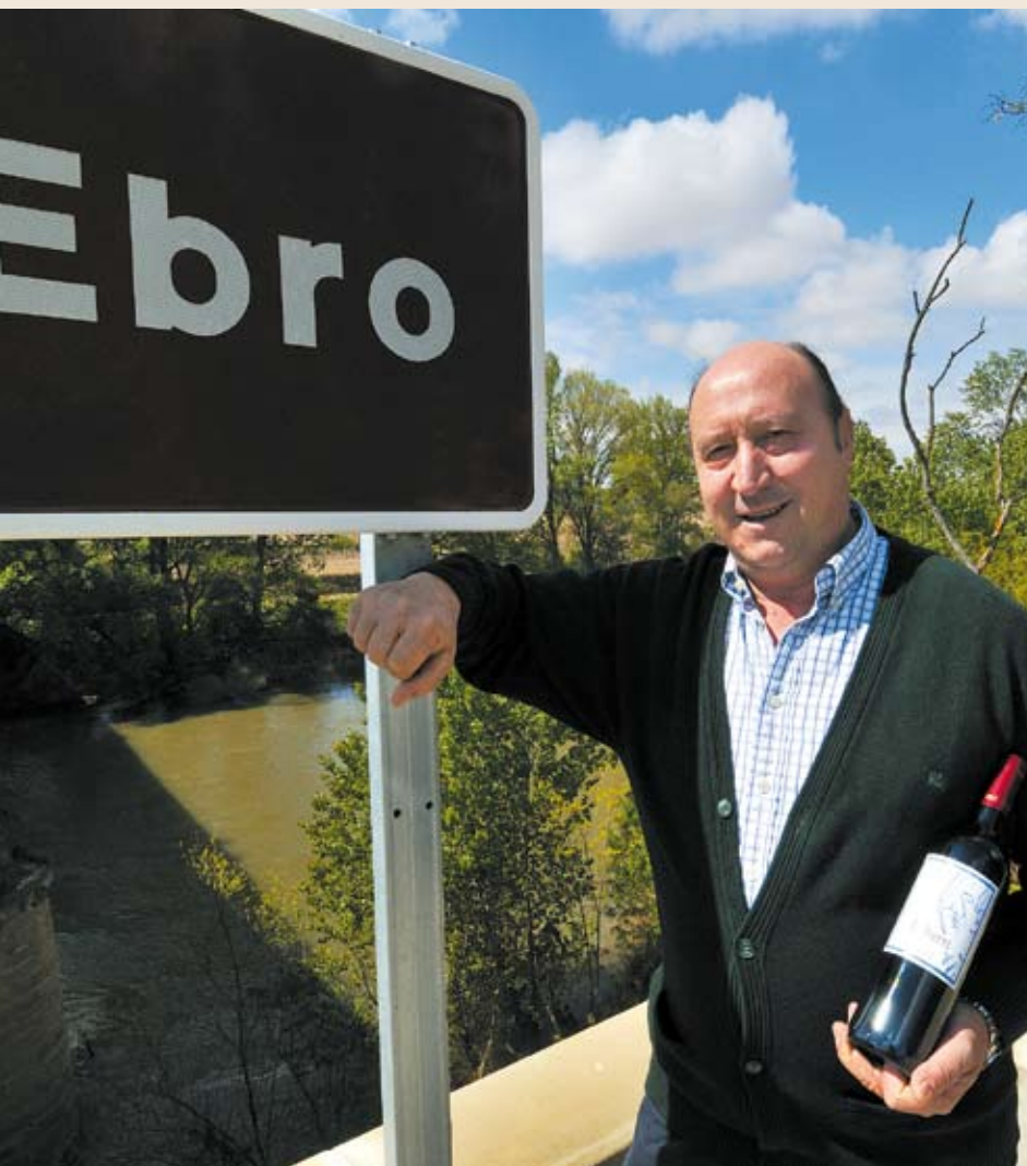
Ríos de vino: el Ebro. Pág.18