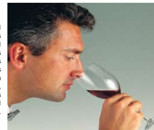
Siguiendo el ejemplo de los jugadores de fútbol y de las estrellas de Hollywood, los catadores famosos ya empiezan a asegurarse, con contratos millonarios, el sentido del olfato.

Son muchos los famosos que aseguran partes de su cuerpo fundamentales para el desarrollo de su actividad. Son los denominados «seguros extraordinarios». Por ejemplo, algunos cantantes tienen aseguradas sus cuerdas vocales. Pero no sólo los famosos tienen acceso a estas pólizas; cada vez son más los profesionales (cirujanos, enólogos, músicos...) que suscriben seguros especiales para «blindar» aquellos elementos que consideran fundamentales para su trabajo. En el mundo del vino, el caso más sonado es del bodeguero y catador holandés Ilja Gort, propietario del Château de la Garde (Burdeos), que ha asegurado la pérdida de su nariz o su sentido del olfato por cinco millones de euros en la aseguradora londinense Lloyd's. Lo hizo tras enterarse de que un hombre había perdido el sentido del olfato en un accidente automovilístico. El contrato incluye una singular lista de cláusulas: no puede conducir una moto ni ser boxeador, asistente de lanzador de cuchillos o tragafuegos.